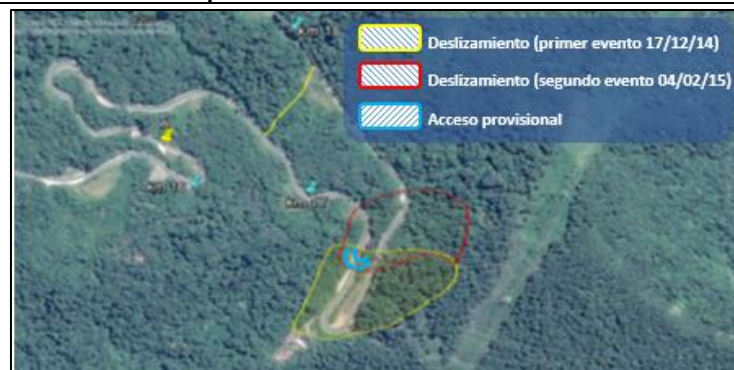
Imagen N° 3 Intervención realizada por la Entidad Prestadora en el Km 17 de la concesión

En ese contexto, difundió imágenes a través de las cuales mostró a los miembros del CRU Loreto-San Martín, el estado de la vía antes del siniestro y después de ocurrido éste; así como las intervenciones realizadas por la Entidad Prestadora para habilitar un acceso provisional.