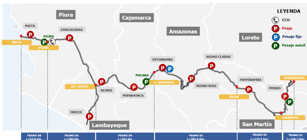
Imagen N° 1 Carretera Red Vial IIRSA Norte