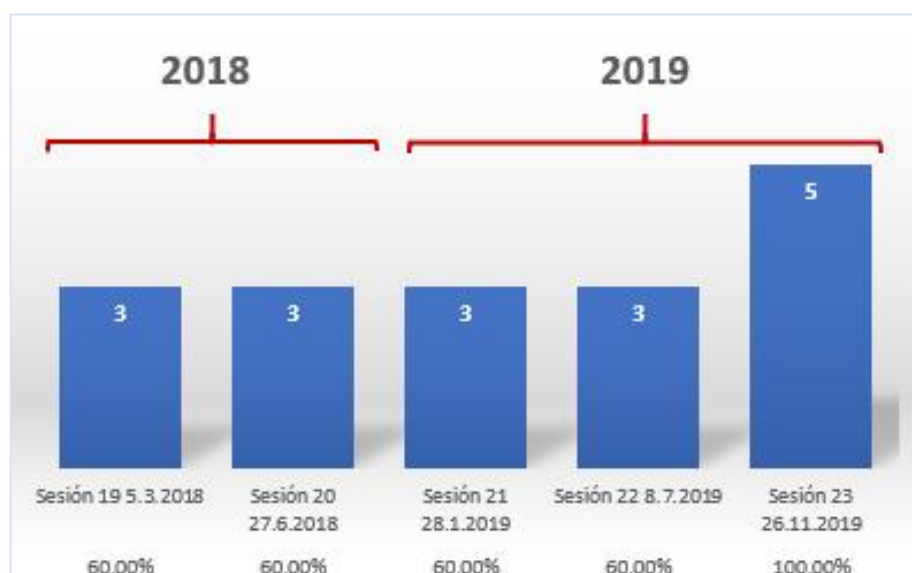
Gráfico 1 Sesiones del CRUP desarrolladas durante el Periodo 2018-2020