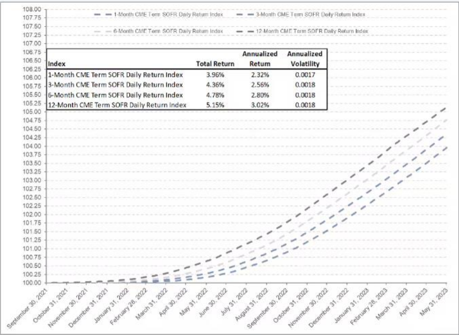
Gráfico N°3 ÍNDICE DE RENDIMIENTO DIARIO DE LA CME TERM SOFR A PLAZO DE 1,3,6 Y 12 MESES