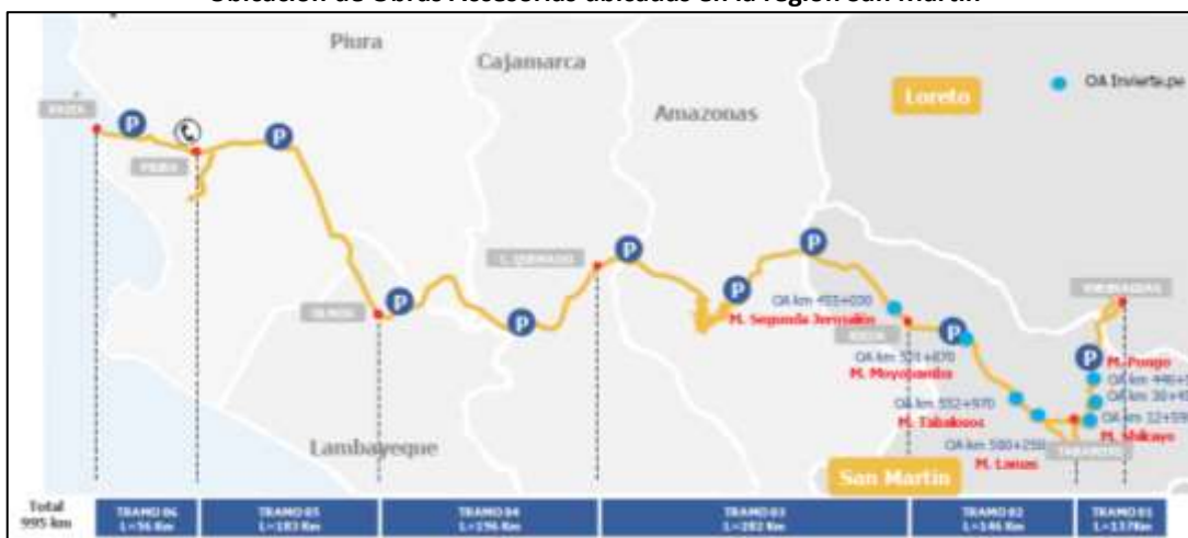
Imagen N°2 Ubicación de Obras Accesorias ubicadas en la región San Martín

En ese marco, precisó que en la región San Martín se cuenta con siete (7) obras accesorias con aprobación técnica del Ministerio de Transportes y Comunicaciones que han sido elaboradas en el marco del INVIERTE.PE, las cuales se encuentran ubicadas en los puntos celestes identificados en la siguiente imagen: