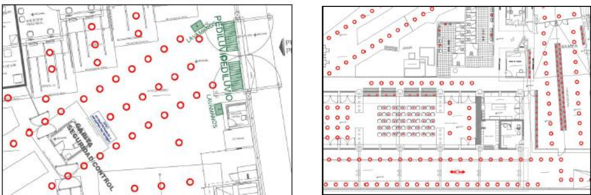
Imagen N° 1 Señalización para uso de Estación MachuPicchu

A modo de ejemplo, presentó la señalización a implementarse para el uso de la estación Machupicchu y Ollantaytambo, entre las que se advierte la instalación de señalética destinada a promover la distancia entre los usuarios de la infraestructura; así como aquellas destinadas a orientar el ingreso y salida de los pasajeros.