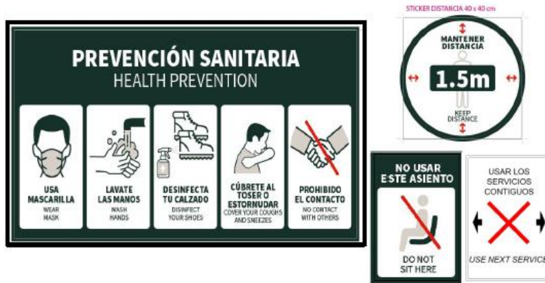
Imagen N° 3 Señalética elaborada por FETRANSA