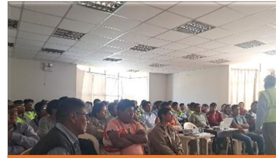
Capacitación en Manejo Defensivo y Seguridad Vial dirigida a conductores y transportistas que transitan por el tramo vial concesionado