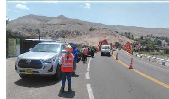
Control de Velocidad en el tramo vial concesionado en conjunto PNP, SUTRAN Y COVINCA