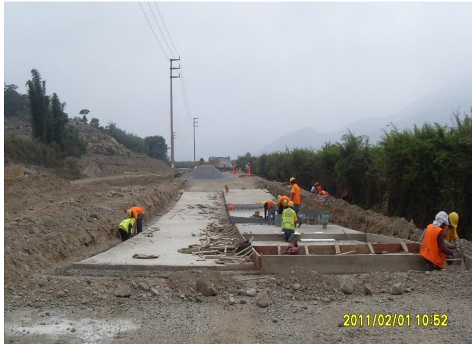
Construcción de Badén