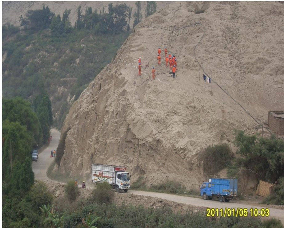
Corte en Roca