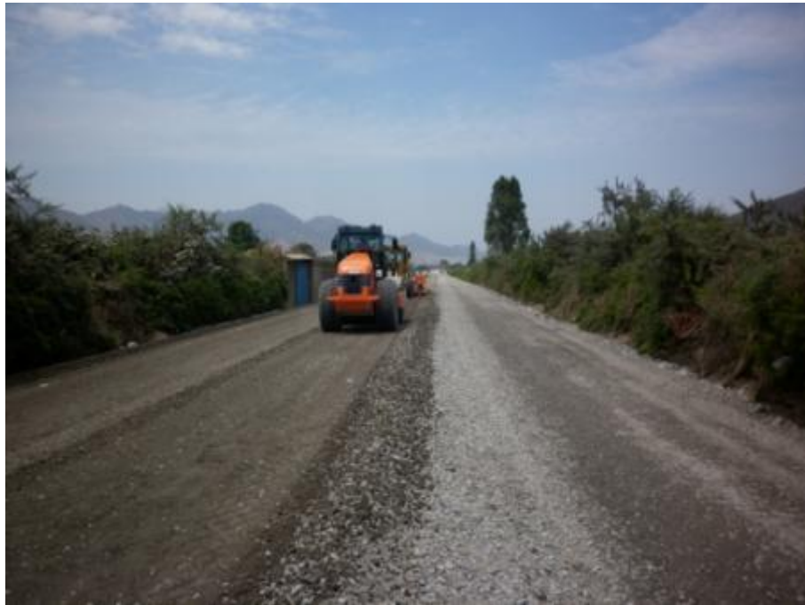
Conformación y Batido de Base