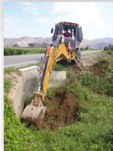
Limpeza de alcantarillas

Limpeza de I Limpeza de V Limpeza de E Recolo de S Pintado de G Reposicion de postes Desbroce de vegetación Tratamiento de microfisuras Pintura lineal en pista Reposición de delimitadores Pintado de guardavías Limpeza p/derrame de petróleo