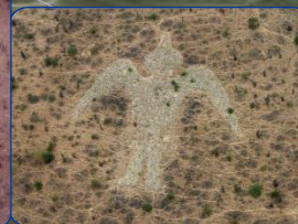
Geoglifos en el Valle del Zaña