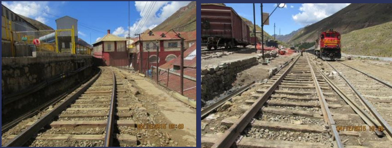
PK 153- 156.00 con Riel de 115 lbs

141.30 kms de vía en 115 lbs/yd al 31 Dic 2015