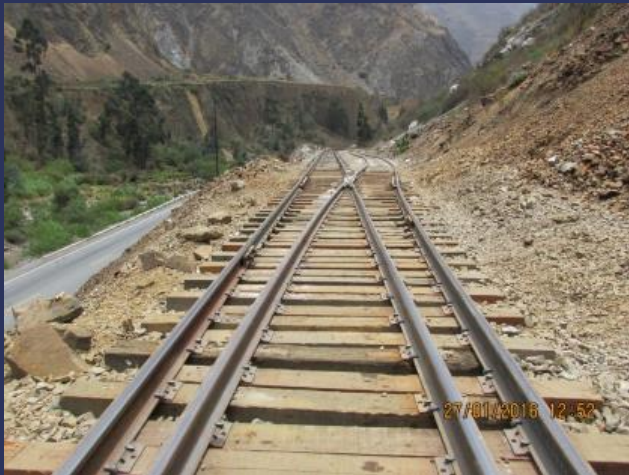
Cambio Lastre Viso Lado Norte

Al finalizar el Proyecto quedarían 46.8 kms en rieles de 80 Lbs. BSA (45.00 kms) y 90 Lbs ARA (2.60 kms)