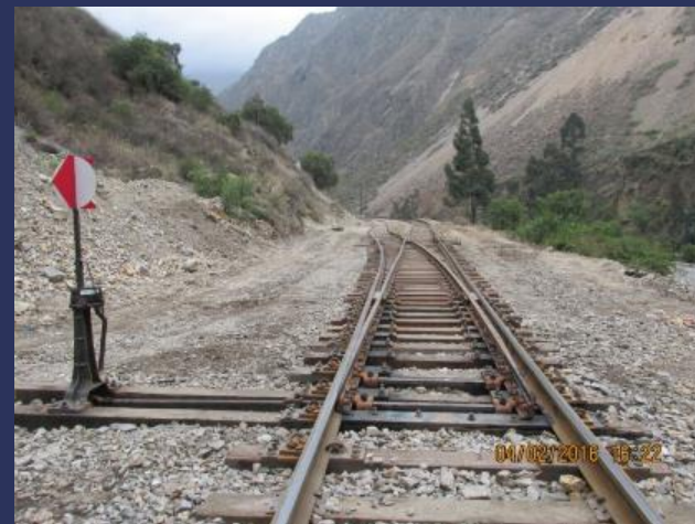
Cambio Lastre Viso Lado Sur