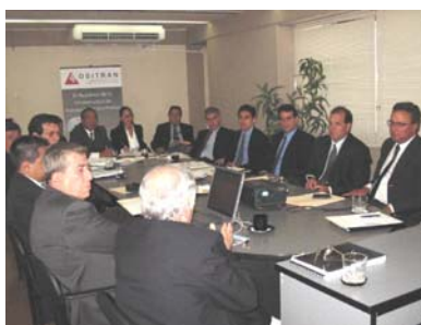
Presentación de ENAPU al CCUP