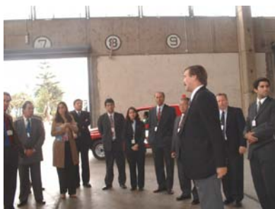
Visita al local de la Mesa de Transferencia del AIJCH

Los miembros del CCUA de OSITRAN, por invitación del gerente general de Lima Airport Partners, asistieron a una visita guiada a las instalaciones del AIJCH, a fin de conocer in situ las inversiones realizadas y el avance de las obras.