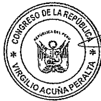
VIRGILIO ACUÑA PERALTA Congresista de la República